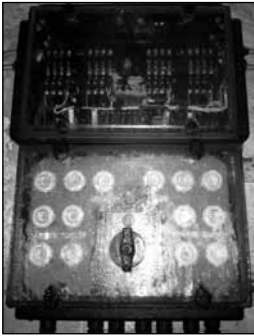
Glockensteuerung mit Schwitzwasser.

Jetzt werden wir die Kirche notdürftig mit Strom versorgen: Ein Baustromverteilkasten liefert den notwendigen Strom für Beleuchtung und die Orgel - und hoffentlich auch bald wieder die Glocken, denn