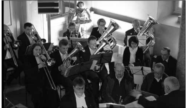
Der Posaunenchor beim Festgottesdienst mit Unterstützung aus dem Rehauer Posaunenchor.

Dieser Jubiläumsgottesdienst unter besonderen Bedingungen - ohne Strom und Heizung - wird sicher lange in Erinnerung bleiben.