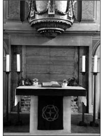
Blick hinter das Altarbild: der abgebrochene alte Wandaltar.

Was kommt dann hin? Der Vorhand wird nicht bleiben, der ist nur eine Zwischenlösung. Es wird auch sicher kein Bild sein, sondern angedacht ist eine Gestaltung mit Stoffen. Wie genau das aussehen kann, dazu macht sich jetzt Prof. Hanns Herpich Gedanken und Entwürfe - und wenn wir mehr wissen, geben wir Ihnen einen Einblick.