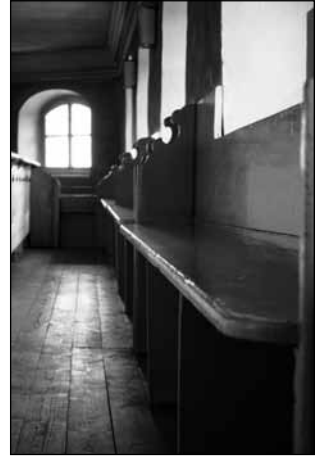
Die letzten Bankreihen der Emporen müssen für die Voruntersuchungen abmontiert werden.

Auch die Orgel soll endlich saniert werden. Es ist ein wertvolles Instrument, das wir in unserer Kirche haben: Unsere Steinmeyer-Orgel ist eine der wenigen romantischen Orgeln